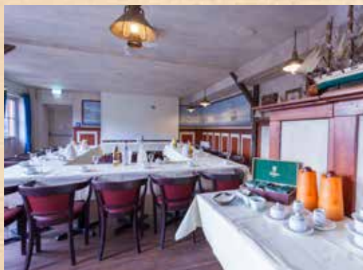
Captain's Room (57 qm)