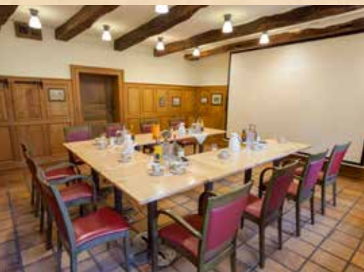
Meyers Kammerfach (70 qm)