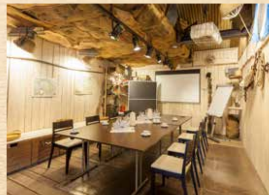
Sambesi-Lodge* (30 qm)

* Die Sambesi-Lodge ist ausschließlich in der Sommersaison (April bis Oktober) und bis max. 20 Personen buchbar.